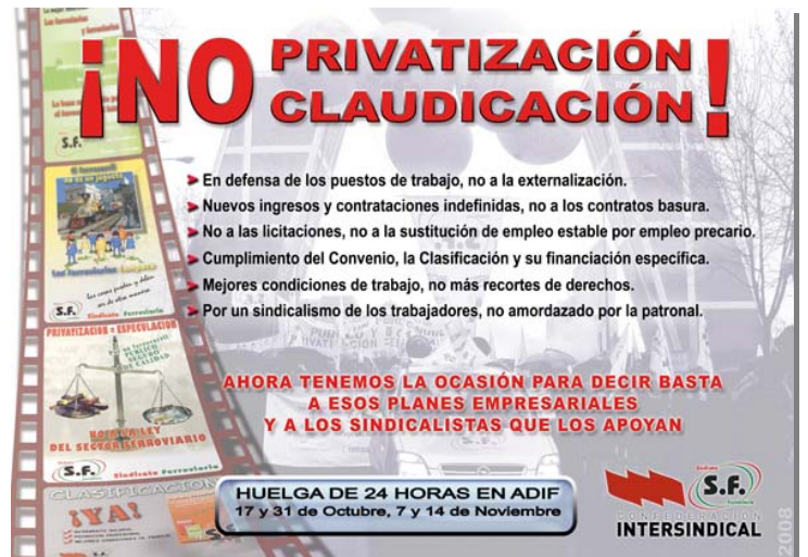
Cartel editado en octubre de 2008 informando de los paros convocados en Adif por el Sindicato Ferroviario en contra de las licitaciones y la situación en la empresa, exigiendo nuevos ingresos con contrato estable.