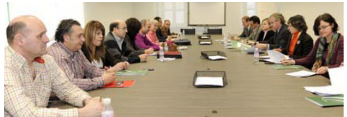
Reunión de la Comisión Mixta de Igualdad y No Discriminación. Aprobado el Plan de Igualdad de Adif.

Entre otras medidas, se establece: Aplicación de la transversalidad de la perspectiva de genero en las políticas y actuaciones llevadas a cabo por la Empresa y continuar con la igualdad de oportunidades como uno de los referentes en la gestión de recursos humanos.