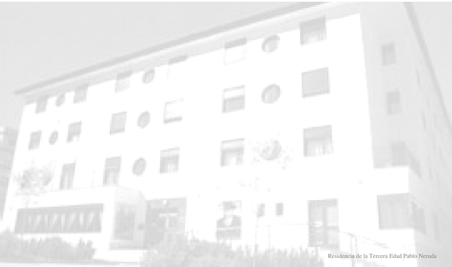
Residencia de la Tercera Edad Pablo Neruda

Contacta con los Delegados y Delegadas de SF-Intersindical para asesorarte de todo ello.