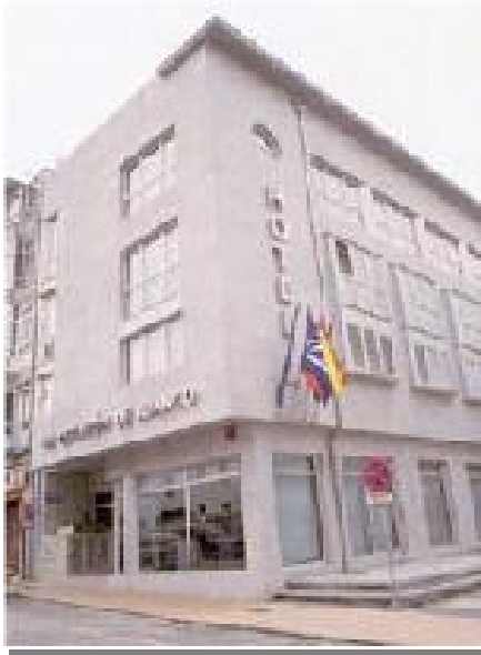
Hotel Estación de Luanco