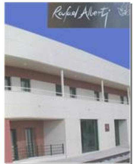
Residencia de la Tercera Edad Rafael Alberti

También queremos promover en el CHF iniciativas encaminadas a ampliar los servicios a todas las comunidades autónomas , acercándolo al conjunto de ferroviarios y ferroviarias y a sus familias.