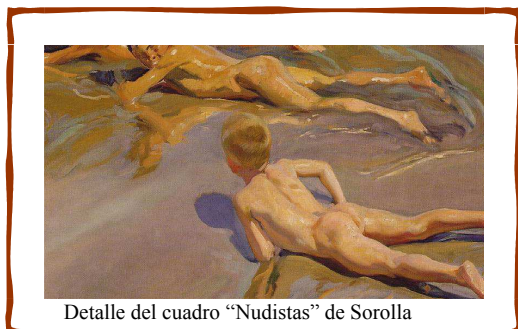
Detalle del cuadro "Nudistas" de Sorolla

¡ Seguimos esperando vuestras colaboraciones! ¡¡ Saludos !!